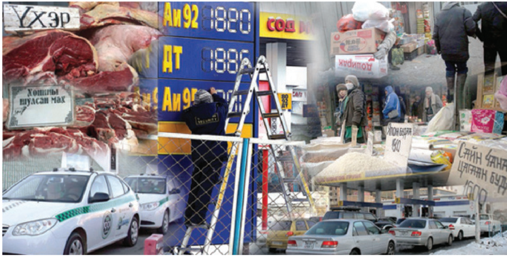
Үргэлжлэл нь III нүүрт