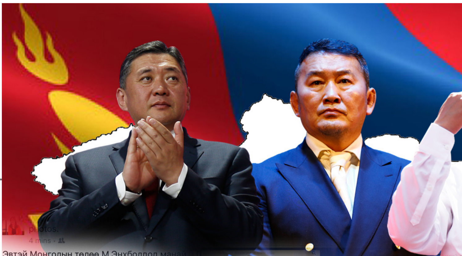
Эвтэй Монголын төлөө М.Энхболдод манай гэр бүл саналаа өглөө..

11:40 цагт: Монгол Улсын Ерөнхийлөгчийн сонгуульд МАН-аас өрсөлдөж буй нэр дэвшигч М.Энхболд 23 дугаар сургуульд байрлах Чингэлтэй дүүргийн 1937 дугаар хэсгийн санал авах байранд саналаа өглөө. Тэрбээр саналаа өгснийхөө дараа “Монголчууд төрийнхөө сонгуулийг хүндэтгэдэг, баяр ёслолын байдалтайгаар мориныхоо дэлийг засаж, гоёлын