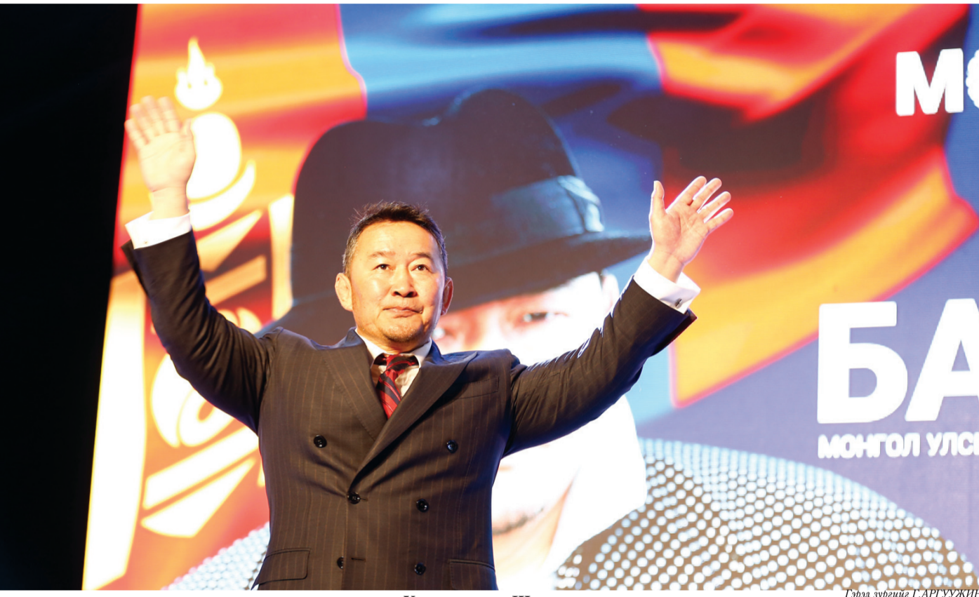
Үргэлжлэл нь III нүүрт

Мөн их Жанжин Д.Сүхбаатарын талбайд ч нийтийг хамарсан үйл ажиллагаа, урлаг соёлын тоглолт явуулахгүй байхаар захирамждаа тусгажээ. Ерөнхийлөгчийн сонгууль өгч буй энэ өдөр бүх нийтийн амралтын өдөр учраас дугаарын хязгааралт үйлчлэхгүй, мөн томоохон зах худалдааны төвүүд ч амарлаа.