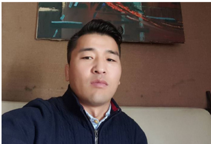
Т.Ганбүргэд: Нэг хүний ч гэсэн санал чухал

/“Авьсаглаг монголчууд” шоуны шилдэг оролцогч “Пароди” халтлагийн жүжигчин/