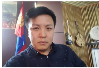
Э.Мөнхтөр: Ирээдүйнхээ төлөө сайн бодож сонголтоо хийгээрэй

/Монголын сагсан бөмбөгийн холбооны ерөнхийлөгч/