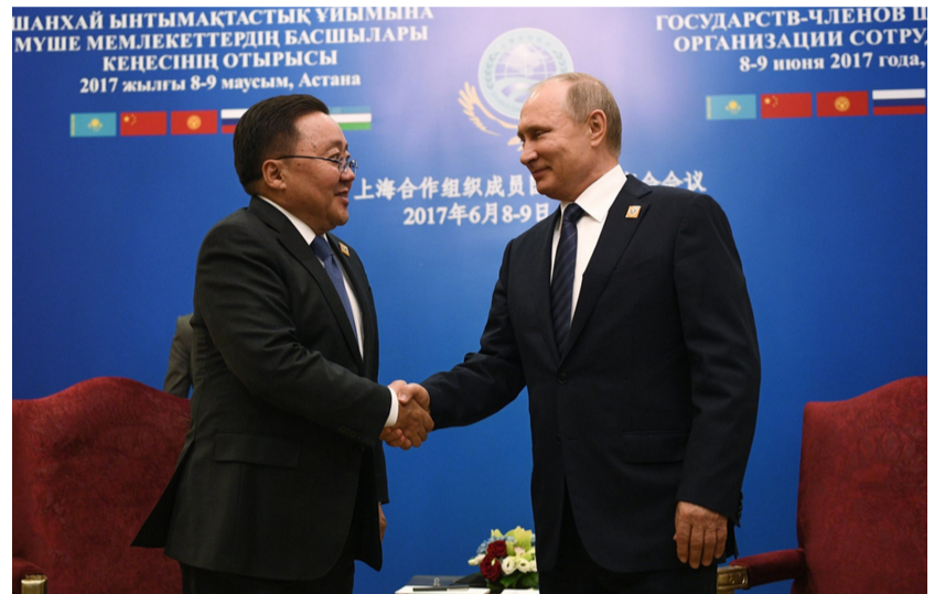
Дэлгэрэнгүйг IV нүүрнээс