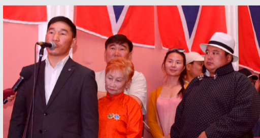
А.Төмөрсүх: М.Энхболд гэх хүн аймагтаа шинэ сум битгий хэл шинэ жорлон ч барьж өгсөнгүй