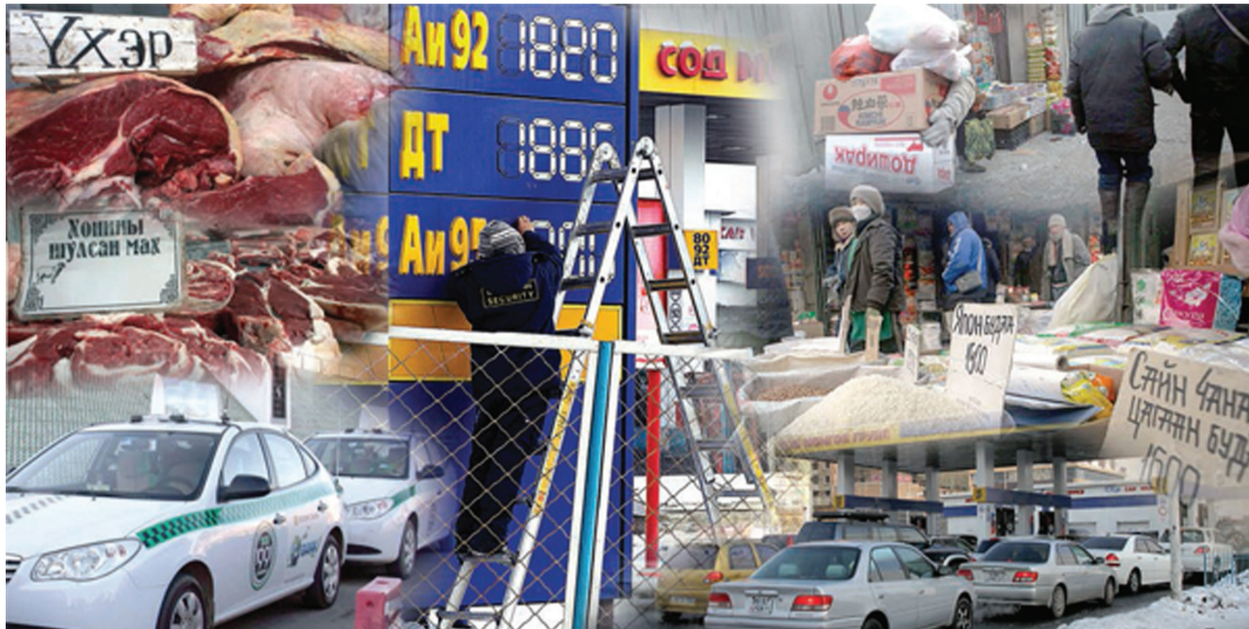
Үргэлжлэл нь III нүүрт