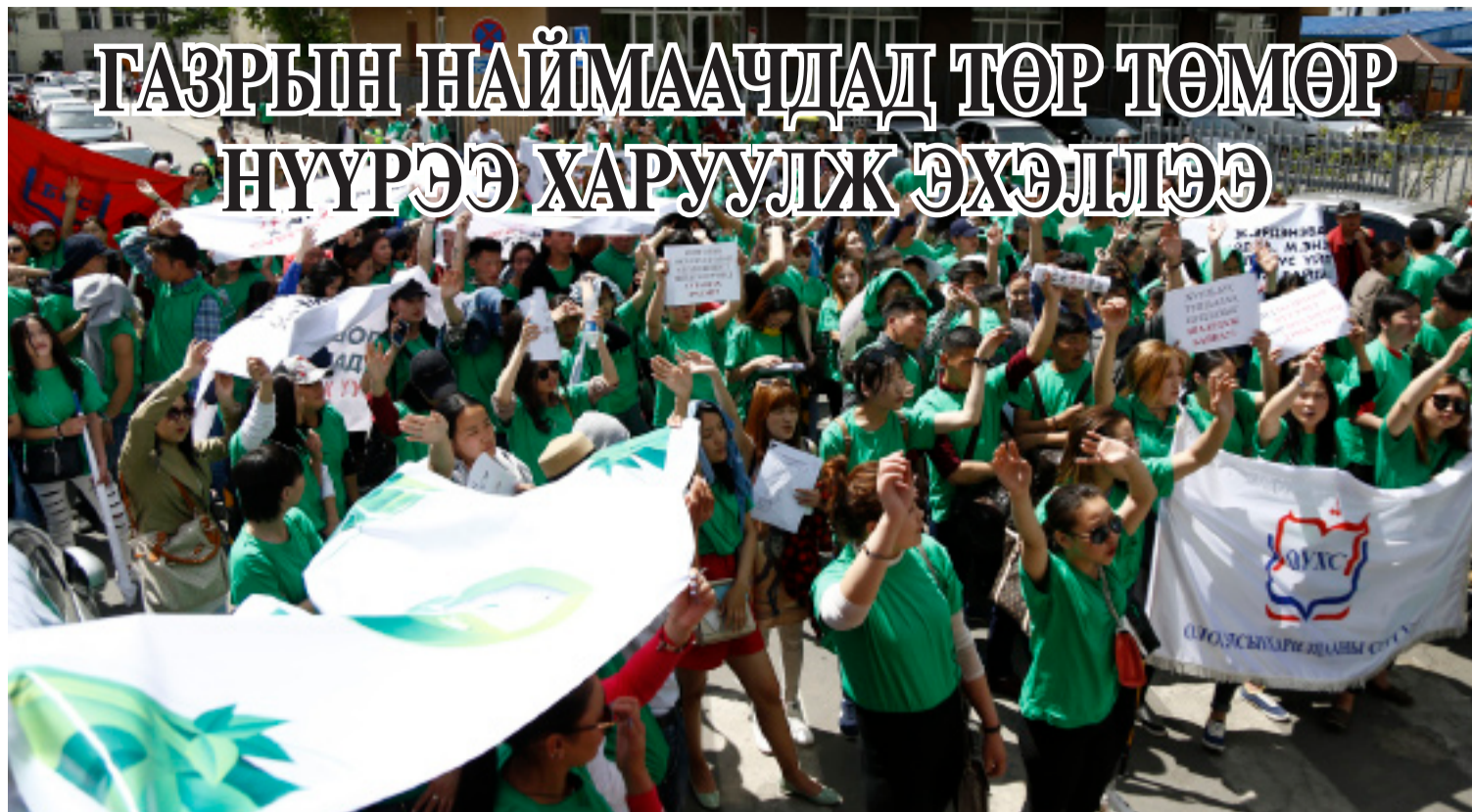
“Энигма” компанийн эрх ашгийн төлөө жагсч буй оюутнууд