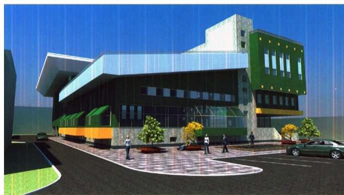
Биеийн тамир, спортын цогцолбор ордны холболтын зураг төсөө

хэмжээний зардалд гол горхн, булаг шандын эхийг хамгаалах, ус нөөцлөх сав суурилуулах, худга гаргах, усны зөөврийн автомашин худалдан авах гээд нилээдгүй ажил төлөвлөсөн. Орон нутгийн хөгжил сангийн хөрөнгө оруулалтаар аймгийн төвийг теле камерын системд холбох, нэг наймдугаар байрны фасад, 15-р байрнаас Хөдөлмөр, халамж, үйлчилгээний хэлтэс