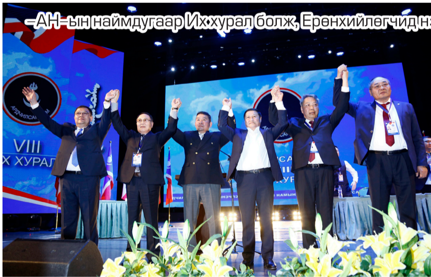
“АН-ын наймдугаар Их хурал болж, Ерөнхийлөгчид нэр дэвшигчээ баталгаажууллаа”