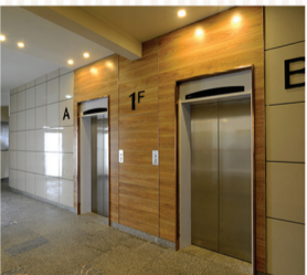
АНУ-ЫН "THYSSEN KRUPP" БРЭНДИЙН ЦЭВЭР ГАН ЦАХИЛГААН ШАТ