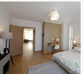
ҮНДЭСНИЙ БҮТЭЭН БАЙГУУЛАГЧ "MEGAWOOD" БРЭНДИЙН ХААЛГА

Х-Апартментын хаяг: Баянзүрх дүүрэг, Офицеруудын ордоны зүүн урд талд Захиалга авах хаяг: Сүхбаатар дүүрэг Улсын драмын театрын хойд талд "УЛААНБААТАР ПРОПЕРТИЗ" ХХК өөрийн байранд