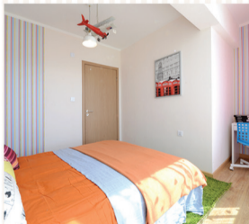
СОЛОНГОСЫН "LG HAUSYS" БРЭНДИЙН ЭКО ХАНЫН ЦААС