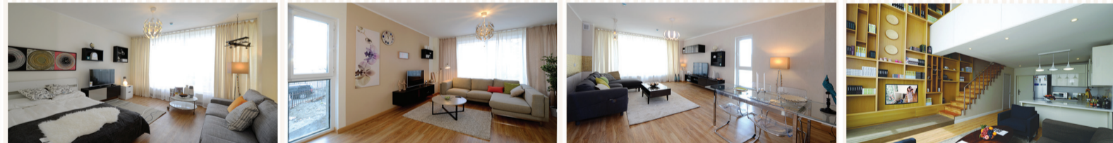
Стандарт загвар: 1 өрөө 30 - 32 мкв

Эрхэм захиалагчдаасаа 14 хоног бүр iPhone 6S гар утасны АЗТАН тодруулдаг, дэлхийд технологиор тэргүүлэгч Япон, АНУ, Герман, Австри, Швейцарь улсын брэндүүдээр тоногосон Залуусын хотхон "X Apartment"-ыг та бүхэндээ танилцуулж байна. Залуусын хотхон "X APARTMENT"-ын 30 - 82мкв талбайтай 1-3 өрөө энгийн орон сууцны загвараас гадна тансаг зэрэглэлийн төлөвлөлтийг илтгэх дотроо 2 давхар, шалнаас тааз хүртэл нарны гэрэл бүрэн тусах 6м-ийн өндөр цэлгэр том цонх бүхий 37,5 - 112мкв талбайтай 2-4 өрөө DUPLEX загварын орон сууцнаас сонголтоо хийх боломжтой.