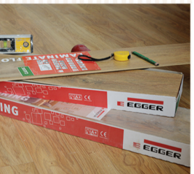
АВСТРИ УЛСЫН ХАГАС ЗУУН ЖИЛИЙН ТҮҮХТЭЙ "EGGER" БРЭНДИЙН ПАРКЕТАН ШАЛ