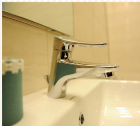
ЯПОНЫ "ТОТО" БРЭНДИЙН АРИУН ЦЭВРИЙН ӨРӨӨНИЙ ТОНОЛЛОЛ

Япон архитекторын орон зайн төгс шийдлээр, бүрэн цутгах технологиор цутгаж, оршин суугчдын тав тухыг дээд зэргээр хангах бүх төрлийн үйлчилгээг нэр дор цогцлоосон, интерьер болон экстерьерийн орчин үеийн загвар бүхий хамгийн бодит үнэтэй орон сууцаа захиалаад 14 хоног бүр АЗТАН шалгаруулах сугалаанд оролцон iPhone 6S гар утас хожих боломжийг зөвхөн Залуусын хотхон "X Apartment" олгож байна.