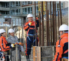
"УЛААНБААТАР МЕНЕЖЕМЕНТ" ХХК-ИЙН САЙН ЧАНАРЫН ОРОС АРМАТУР