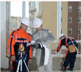
ГЕРМАНЫ ДЭЛХИЙД ТЭРГҮҮЛЭГЧ "ВЕКА" БРЭНДИЙН ВАКУМ ЦОНХ