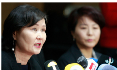
Ц.Отгончимэг: Энэ удаагийн сунгалт зуны амралтад нөлөөлөхгүй

-Ус, цаг уур, орчны шинжилгээний газраас ирэх долоо хоногт ихэнх нутгаар эрс хүйтэрч, цасаар шуурна гэж мэдээлсэн хэргийг холбогдуулан БСШУС-ын сайд сурагчдын амралтыг нэгдүгээр сарын 30-ныг хүртэл сунгах тухаал гаргасан. Энэхүү долоо хоногийн амралтаас шалтгаалж, зуны амралтын хуваарьт өөрчлөлт орохгүй. Мөн хөдөөгийн сургуулиуд амралтаа дуусгаад, хичээллэж байгаа. Завхан, Ховд аймгийн удирдлагуудаас ирсэн хүсэлтийг авч хэлэлцээд, амралтыг долоо хоног сунгасан. Цэцэрлэгүүд хэвийн ажиллана. Энэ сарын 16-ны орой сурагчдын амралтыг сунгахгүй гэсэн мэдээлэл цахим хуудсуудаар тарсан. Энэ бол манайхаас гарсан албан ёсны шийдвэр биш байсан.