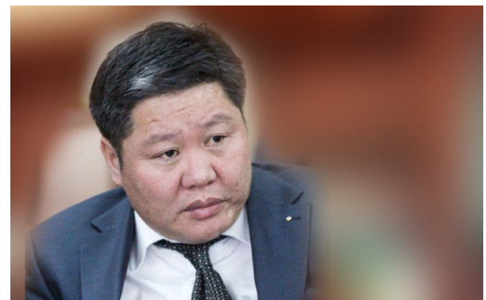
Г.Ганбат: Өөрсөдөө зориулсан хуулийг баталчихдаг болоод байна

“Эр нь улстөрчид аливаа сонгуулийн өмнө өөрсөдөө ашигтайгаар хуульд өөрчлөлт оруулдаг болоод байгаа. Энэ удаад МАН-ынхан ч өөрсдийнхөө хүсэл зоргоор л хуулиа батлах нь. УИХ-д суудалгүй улс төрийн намуудын төлөөлөл байр сууриа илэрхийлээд гээд хүчтэй нөлөөлж чадахгүй нь ойлгомжтой байх. Учир нь хэн эрх мэдэлтэй байна. Тэр л өөрт таалагдсан хуулиа баталчихдаг болоод байгаа.