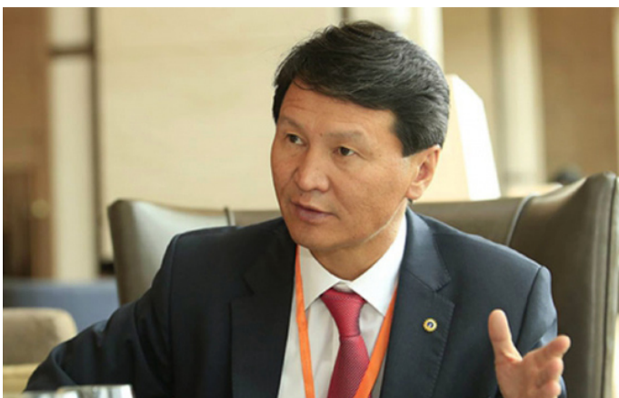
Б.Цогтгэрэл: Ерөнхийлөгчийн сонгуулийн хуулийг сулруулсан байна