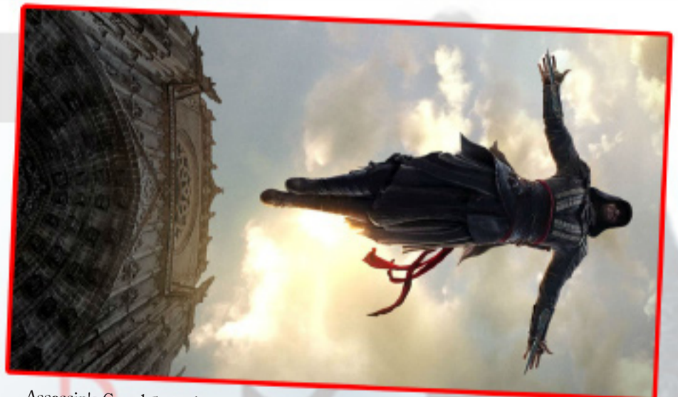
Assassin's Creed буюу Алуурчны үнэмшил видео тоглоомоос сэдэвлэн бүтээв.

Аз жаргал, зовлон гуниг, хайр дурлал, хардалт, амжилт, бүтэлгүйтэл гээд л хар, цагаан хосолж байдаг хүний амьдралд бид төрөхдөө "Амьдралын сурах бичиг"-ээ өвөртлөөд ирдэг бол хичнээн сайхан! Өөрийн биеэр туулж байж л амьдралын зах зухаас мэдэж, сурч, туршлагажиж ухаардаг. Энэ бол "Амьдралогч" юм. Тэгвэл амьдралынхаа 2 дахь үеийн хямралд орсон гэр бүлийн хос, амжилттай яваа ч заяаны ханна хараахан олоогүй бүсгүй, залуу халуун насныхаа алдаа, оноог дэнслүүлэн яваа оюутан охин болон киноны бусад дүрүүдийн аз жаргалын төлөөх тэмцэл болон тэдний санаанд оромгүй сонголтуудыг "Амьдралогч" романтик инээдмийн уран сайхны киноноос үзээрэй.