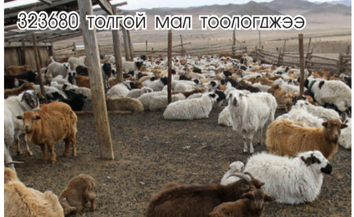
323680 толгой мал тоологджээ

Дархан-Уул аймгийн хэмжээнд 2016 оны мал тооллогын дүнгээр 323680 толгой мал тоологдон нь өнгөрсөн оны мөн үетэй харьцуулбал 35317 толгой малаар буюу 12.2 хувиар өсчээ. Нийт тоологдсон малын 319.4 мянган толгой буюу 98.7 хувийг амины мал эзлэж байна. Улсын хэмжээгээр 61542.0 мян толгой мал