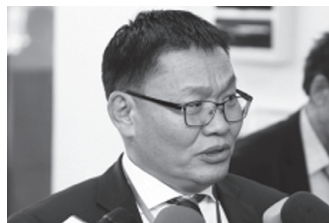
/АН-ын Ерөнхий нарийн бичгийн даргын үүрэг гүйцэтгэгч/

-АН улс төрийн намынхаа хувьд төлөвшилийн шинэ үе шатанд ирж байна. Шинэтгэлийн асуудал бол зөвхөн зургадугаар их хурлаар хийгдээд зогсчих дуусчих асуудал биш. АН-ыг фракцад хуваагдсан хувьчлагдсан гэсэн шүүмжлэлийг жирийн гишүүдээс ирүүлж байгаа. Тиймээс бүртгэлийг цахимаар хийдэг бол, харууцлагын тогтолцоотой бол, нээлттэй ил тод зарчимд шилжнэ, итгэл даадаг нам болж төлөвшнэ гэдэг зарчмын асуудлуудыг АН-ын шинэтгэлийн хөтөлбөрөөрөө хэлэлцэж батлах гэж байна.