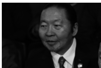
/УИХ-ын гишүүн асан/

-АН шинэчлэлийнхээ хөтөлбөрийг энэ Их хурлаараа хэлэлцэж байна. Шинэчлэлийн нэг чухал зүйл нь мэдээж хэрэг намын дүрмийн шинэчлэлийн асуудал юм. Дүрмийн шинэчлэлийн