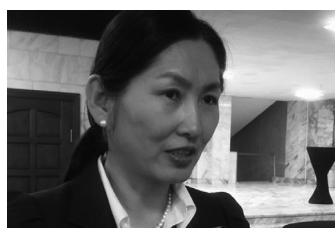
/УИХ-ын гишүүн асан/

-Өнөөдрийн /өчигдөр/ намын Их хуралд хэлэлцүүлэхээр оруулах дүрмийн өөрчлөлтийн төслийг ҮЗХ-оор хэлэлцэж дэмжээд, оруулж ирсэн. Ер нь гишүүд хийх гэж буй шинэчлэлүүдийг маш их дэмжиж үг хэлж байна. Яг одоо бол орон нутгаас ирсэн гишүүд үг хэлж байна. Намаа гишүүдээ эрх мэдэл олгосон буюу хаалга үүд нь нээлттэй өргөн хүрээнд хамтарч ажиллах чадах чадвартай нам болгох тал дээр олон гишүүн дэмжиж санал хэлж байна. Шинэчлэлийн хамгийн эхний