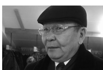
/УИХ-ын гишүүн асан/

-Манай намын дүрэм угаасаа тийм муу биш. Учир нь бид 2000 онд АН-ын Их хурлыг таван нам нийлж хийхдээ маш сайн боловсруулж баталсан. Миний мөнхийн байр суурь бол энэ сайн дүрмээ өнгөрсөн хугацаанд хэрэгжүүлж чадаагүй. Ерөөсөө л хэн намын дарга болно тэр хүн өөрийнхөөрөө л явж байсан. Тиймээс өнөөдөр АН-ын нэр