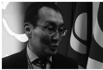
/УИХ-ын гишүүн асан/

-АН-ын дүрмийн төсөлд үндсэндээ зургаан үндсэн өөрчлөлтийн багана байгаа. Манай намыг хамгийн их шүүмжилдэг, эв нэгдэлгүй өөр хоорондоо зөрчилддөг гэдэг. Зөрчил нь намынхаа хил хязгаараас халиад төрийн үйл хэрэг рүү орж ирдэг гэдэг шүүмжлэл байдаг. Тиймээс энэхүү дотоод зөрчилдөөнөө дотроо зөв зохистой шийдвэрлэх чадварт АН суралцахгүйгээр нэгдмэл нэг зорилттой нам байж чадахгүй