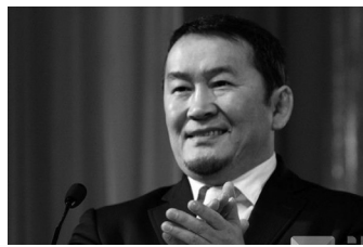
/УИХ-ын гишүүн асан/

-Манай намын их хурал олон жил болсонгүй. Энэ удаагийн хурлаар намынхаа доторх асуудлыг ярьж гэж байна. Тэгэхдээ шинэчлэл нэрийн дор явж байна. Хувь хүнд ч гэсэн шинэчлэл хэрэгтэй. Монгол Улс ч гэсэн шинэчлэгдэх болсон шиг байна. Бид 1990 онд нэг улсаас хараат байна, тусгаар тогтносон улсын чадамж алга гэж ярьж байсан. Одоо хөршөө сольчихсон чинь урд хөршөөсөө хамааралтай болчихлоо. Эдийн засаг болоод бүхий л шийдвэрүүд урд хөршөөсөө хамааралтай болсныг дүгнэж ярих хэрэгтэй болсон юм болов уу гэж бодож байна. Ганцхан манай нам ч биш. Монгол Улс тэр чигээрээ энэ талаар ярих ёстой болсон. Эдийн засгийн хараат боллоо, шийдвэр гаргаж чадахаа болилоо гэсэн зүйлүүдийг ярих байх. Миний бодлоор зөв. Яагаад гэвэл их хурлаар даргаа сонгодог. Нөгөө дарга нь таалагдахгүй бол фракциуд нь нийлдэг ч юм уу. АН-ын гишүүдээсээ сонгогдсон намын дарга нэлээд байр суурьтай, дэмжлэг авсан учраас зоригтой зүйлүүдийг хийгээд явчих болов уу гэсэн бодолтой байна. Ер нь чөлөөтэй шүү дээ. Энэ заалнаас ч хүн нэр дэвшиж болно. Би намын даргад нэр дэвшихгүй.