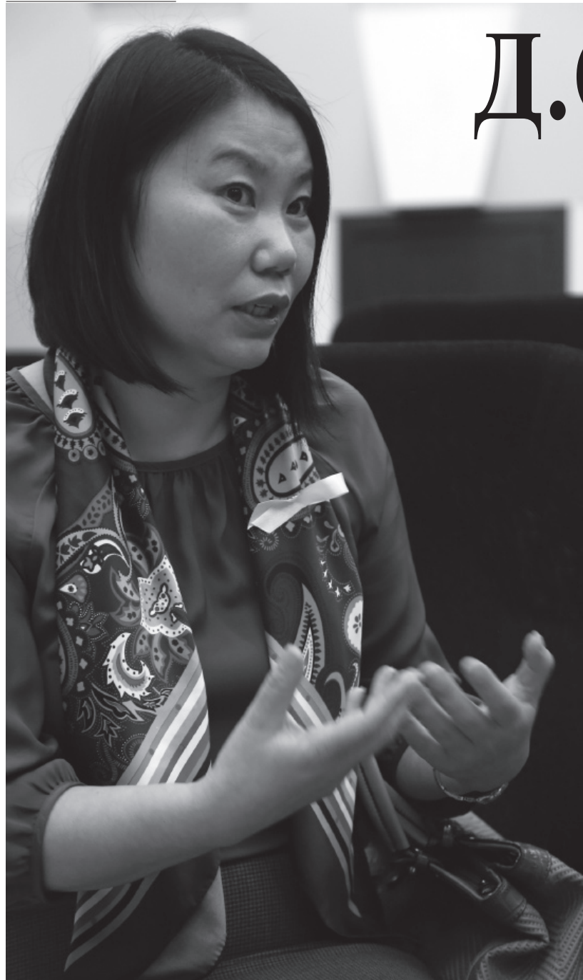
Гэвч урьд нь Гэр бүлийн