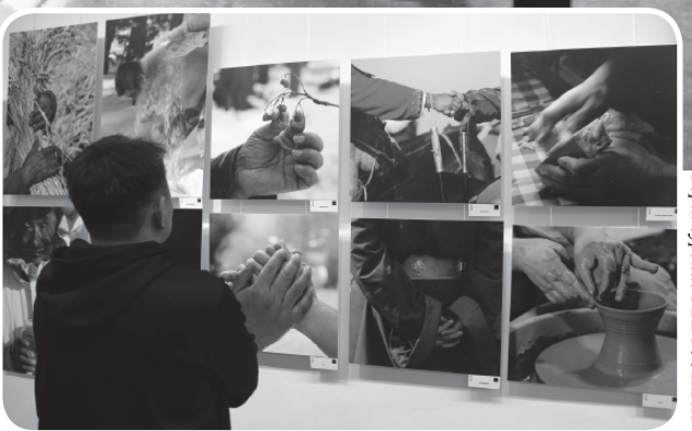
НИМЭЭЛЭН 1 өрмөц 1 өрмөц

АДАМХАНД "ДУЛААН ГАР" ГЭРЭЛ ЗУРГИЙН ҮЗЭСТЭЛЭ