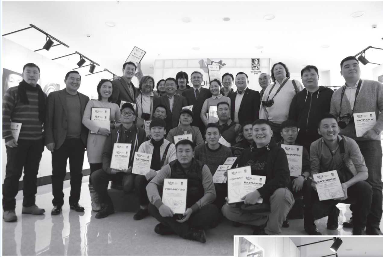
Гэрэл зургийн ГАРТУУХИНЫ

Монгол улс тунхагласны түүхт 92 жилийн ойн баярыг угтан “ЧИНГҮНЖАВ САН”-аас мэргэжлийн гэрэл зурагчид болон гэрэл зураг сонирхогчдын дунд “Монгол орон, Монголчууд миний дуранд” /МММД/ гэрэл зургийн уралдааныг зохион байгуулсан билээ. Гэрэл зургийн бүтээлээр дамжуулан хүүхэд залуучуудад эх орноо хайрлах, улс үндэстнээрээ бахархах хүмүүжил олгох, гадаадын улс орон, зочид төлөөлөгчид, жуулчидад зургийн цомог хэлбэрээр хэвлэн гаргаж эх орноо сурталчилан таниулах нь энэхүү уралдаан зорилго байлаа. Тэгвэл өнгөрсөн баасан гарагт “Монгол орон, Монголчууд миний дуранд” /МММД/ гэрэл зургийн уралдааны шилдэг 100 бүтээлийн үзэсгэлэн “Хүннү Молл”-д байрлах “Гамма” галерейд нээлтээ хийлээ. Энэхүү уралдаанд 400 гаруй гэрэл зурагчдын 1800-гаад бүтээл ирснээс шилдэг 100 гэрэл зургийн эзэн батламжлаа гардаг авсан юм. Эдгээр 100 уран бүтээлчийн гэрэл зураг Англид гарах гэрэл зургийн үзэсгэлэнд тавигдах ажээ.