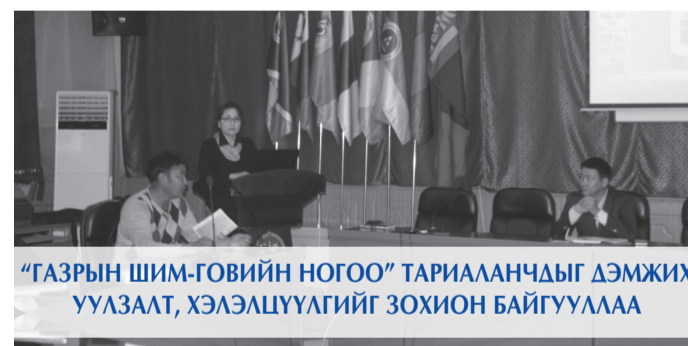
“ГАЗРЫН ШИМ-ГОВИЙН НОГОО” ТАРИАЛАНЧДЫГ ДЭМЖИХ ҮҮЛЗАЛТ, ХЭЛЭЛЦҮҮЛГИЙГ ЗОХИОН БАЙГУУЛАА

Аймгийн Иргэдийн Төлөөлөгчдийн Хурлын 2016 оны 02/11 дүгээр тогтоолоор аймгийн Засаг даргын “Хөгжлийн төлөө хамтдаа” үйл ажиллагааны хөтөлбөрийг батлууллаа. Хөтөлбөрт сумд, агентлаг, төрийн байгууллага, иргэдээс нийт 460 гаруй санал ирсэн ба иргэдийн саналд үндэслэн дөрвөн үндсэн бодлогын хүрээнд 79 тэргүүлэх зорилт, 388 арга хэмжээг хэрэгжүүлэхээр ажиллаж байна.