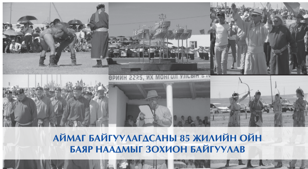
АЙМАГ БАЙГУУЛАГДСАНЫ 85 ЖИЛИЙН ОЙН БАЯР НААДМЫГ ЗОХИОН БАЙГУУЛАВ