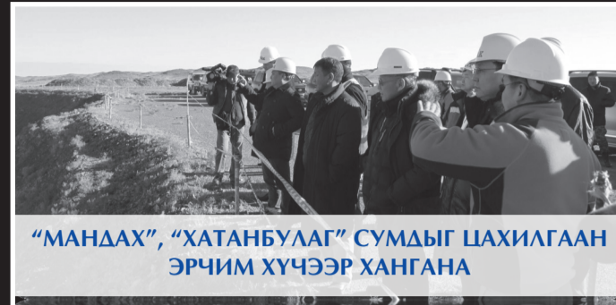
“МАНДАХ”, “ХАТАНБУЛАГ” СУМДЫГ САХИЛГААН ЭРЧИМ ХҮЧЭЭР ХАНГАНА

“Өвсний үндэс-Хүний аюулгүй байдлыг хангах буцалтгүй тусламжийн хөтөлбөр”-ийн хүрээнд аймгийн Засаг дарга, Япон Улсын Элчин сайдтай гэрээ байгуулан 800.0 сая төгрөгийн хөрөнгө оруулалтаар Дорноговь аймгийн “Өргөн” суманд 100 хүүхдийн цэцэрлэгийг шинээр барьж, “Эрдэнэ” сумын хүүхдийн цэцэрлэгийн их засварын ажлыг 150.0 сая төгрөгийн хөрөнгө оруулалтаар хийж ашиглалтад хүлээлгэн өглөө.