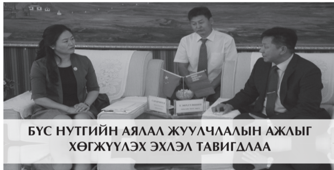
БҮС НУТГИЙН АЯЛАА ЖУУЛЧЛАЛЫН АЖЛЫГ ХӨГЖҮҮЛЭХ ЭХЛЭЛ ТАВИГДЛАА

АНУ-аас Монгол Улсад суугаа Онц бөгөөд бүрэн эрхт Элчин сайд, хатагтай Женифер Зимдал Гаит 2016 оны долдугаар сард Дорноговь аймагт айлчлав. Энэхүү айлчлалын хүрээнд Замын-Үүд суманд хүүхдийн цэцэрлэг, сургуулийн барилга барихаар шийдвэрлэсэн бөгөөд барилгын ажлыг 2017 оны II улиралд эхлүүлэхээр боллоо.