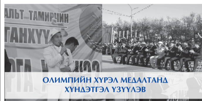
ОЛИМПИЙН ХҮРЭЛ МЕДАЛТАНД ХҮНДЭТГЭЛ ҮЗҮҮЛЭВ

Багш, урлаг, соёлын ажилтнуудын дунд “Спорт 2016” наадмыг есдүгээр сард спортын долоон төрлөөр зохион байгууллаа. Уг спортын наадмыг зохион байгуулахад аймгийн Засаг дарга 4.5 сая төгрөгийн дэмжлэг үзүүлсэн бөгөөд спортын наадмын нээлтэд оролцож нийт баг, тамирчдад хүндэтгэл үзүүлэн амжилт хүслээ.