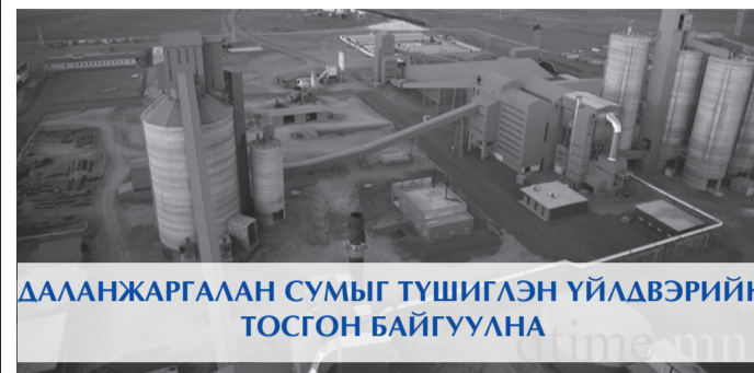
ДАЛАНЖАРГАЛАН СУМЫГ ТҮШИГЛЭН ҮЙЛДВЭРИЙН ТОСГОН БАЙГУУЛАНА

Монгол Улсын Ерөнхий сайд Ж.Эрдэнэбат, УИХ-ын гишүүн Н.Цэрэнбат, Уул уурхай, хүнд үйлдвэрийн сайд Ц.Дашдорж, Эрчим хүчний сайд П.Ганхүү, аймгийн Засаг дарга Т.Энхтүвшин болон холбогдох албаны хүүүүс Мандах сумын “Цагаан суварга” ордын 220 кВт-ын цахилгаан эрчим хүч татах ажлын үйл ажиллагаатай танилцлаа. Мандах сумын “Цагаан суварга” ордоос Мандах, Хатанбулаг сумдыг 35 кВт-ын цахилгаан, эрчим хүчинд холбохоор болов.