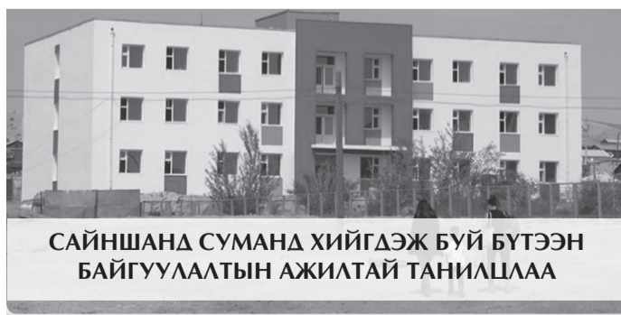
САЙНШАНД СУМАНД ХИЙГДЭЖ БҮЙ БҮТЭЭН БАЙГУУЛАЛТЫН АЖИЛТАЙ ТАНИЛЦЛАА

Улаанбаатар Төмөр замын хувь нийлүүлсэн нийгэмлэгээс Монгол Улсын Засгийн газрын бодлогыг хэрэгжүүлэх, өсөн нэмэгдэж байгаа ачаа тээврийн эрэлт хэрэгцээг бүрэн хангах зорилгоор Сайншанд-Зүүнбаян чиглэлийн төмөр замыг үргэлжлүүлэн Ханги мандал хилийн боомт хүртэл шинээр төмөр зам барих урьдчилсан чиглэлийн судалгааны ажлыг эхлүүлээ.