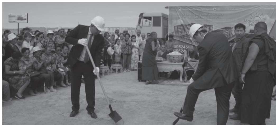
“МАНДАХ НАРАН-1000 АЙЛЫН ОРОН СУУЦ”-НЫ 1 ДҮГЭЭР ЭЭЛЖИЙН ОРОН СУУЦНЫ ШАВ ТАВИХ ЁСЛОЛ БОЛОО

Монгол Улс, БНХАУ, ОХУ-ын Засгийн газар хоорондын хэлэлцээрийн дагуу Хятадын Тяньжин боомт, Улаанбаатар хот, ОХУ-ын Улан-Удэ хотын чиглэлд туршилтын ачаа тээвэрлэлт амжилттай болсноор ачаа тээвэрлэлтийн хугацаа богиносч, зам дагасан үйлчилгээ зоогийн газар, бензин шатахуун, авто машины засвар үйлчилгээ зэрэг ажлын байр нэмэгдэх олон талын ач холбогдолтой юм.