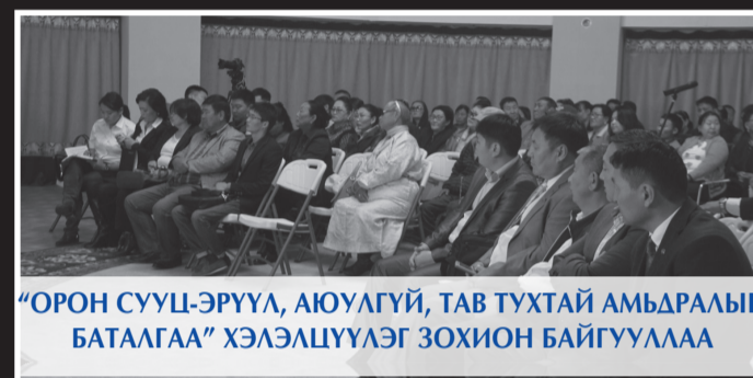
“ОРОН СУУЦ-ЭРҮҮЛ, АЮУЛГҮЙ, ТАВ ТУХТАЙ АМЬДРАЛЫН БАТАЛГАА” ХЭЛЭЛЦҮҮЛЭГ ЗОХИОН БАЙГУУЛАА

Дорноговь аймгийн хүн амын хүнсний хангамжийг сайжруулах, газар тариалан, мал аж ахуй, хүнс, хөнгөн үйлдвэрлэлийн салбарыг сурталчлах зорилгоор жил бүр уламжлал болгон зохион байгуулдаг “Дорноговьд үйлдвэрлэв”, “Алтан намар-2016” үзэсгэлэн худалдааг зохион байгууллаа. Үзэсгэлэн худалдаанд нийт 12 сумын 40 гаруй аж ахуйн нэгж, 100 гаруй иргэн оролцож, өөрсдийн бүтээгдэхүүний дээжээ ард иргэдэд сурталчлан танилцуулав. Энэ үеэр “Мөнх-Ашиг” хоршоо “ШИЛДЭГ ХОРИШОО”-гоор шалгарсан бол “ШИЛДЭГ СУМ”-аар “Эрдэнэ” сум шалгарлаа.