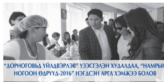
“ДОРНОГОВЬ ҮЙЛДВЭРЛЭВ” ҮЗЭСГЭЛЭН ХУДАЛДАА, “НАМРЫН НОГООН ӨДРҮҮД-2016” НЭГДСЭН АРГА ХЭМЖЭЭ БОЛОВ

Аймгийн Засаг даргын 2016-2020 оны “Хөгжлийн төлөө хамтдаа” үйл ажиллагааны хөтөлбөрийн хүрээнд амьжиргааны баталгаажих түвшнээс доогуур орлоготой болон өрх толгойлсон, бүтэн болон хагас өнчин, хөгжлийн бэрхшээлтэй айлын нийт 31 оюутанд орон нутгийн төсвөөс сургалтын төлбөрийн дэмжлэг үзүүлээ.