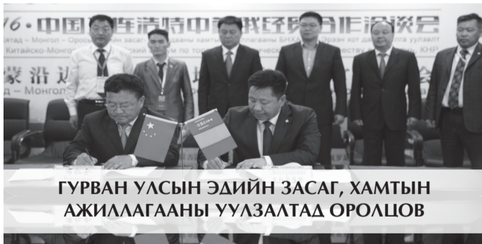
ГУРВАН УЛСЫН ЭДИЙН ЗАСАГ, ХАМТЫН АЖИЛААГАНЫ УУАЗАЛТАД ОРОЛЦОВ

Дорноговь аймаг болон Япон улсын Шизуока муж хооронд байгуулсан ах дүүгийн найрамдалт харилцааны таван жилийн ойн баярыг 2016 оны наймдугаар сард тэмдэглэн өнгөрүүлээ. Энэхүү арга хэмжээний хүрээнд Япон улсын Шизуока мужаас 30 сурагч, таван багш, мужийн дарга тэргүүтэй 20 албаны хүн Дорноговь аймагтай танилцсан. Мөн сурагч солилцооны хөтөлбөрийн хүрээнд 2016 оны аравдугаар сард 30 сурагч, гурван багш Япон улсын Шизуока мужийн түүх соёл, ёс заншил, бүтээн байгуулалттай танилцаад ирлээ.