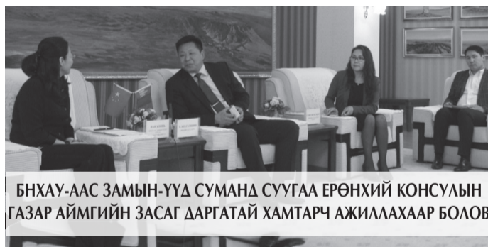
БНХАУ-ААС ЗАМЫН-ҮҮД СУМАНД СУУГАА ЕРӨНХИЙ КОНСУЛЫН ГАЗАР АЙМГИЙН ЗАСАГ ДАРГАТАЙ ХАМТАРЧ АЖИЛААХААР БОЛОВ

Монгол Улсын Засгийн газрын гишүүн, Шадар сайдын ажлын албаны даргаар ахлуулсан ажлын бүрэлдэхүүнийг Замын-Үүд эдийн засгийн чөлөөт бүстэй танилцуулж, чөлөөт бүсэд үйл ажиллагаа явуулах аж ахуйн нэгж, байгууллагын барилга, байгууламжийн ажлыг 2017 оноос эхлүүлэхээр шийдвэрлэв. Цаашид Замын-Үүд эдийн засгийн чөлөөт бүсийн асуудлыг хариуцсан байнгын ажиллагаатай хамтарсан ажлын хэсэг гаргаж ажиллахаар болов.