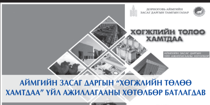
АЙМГИЙН ЗАСАГ ДАРГЫН “ХӨГЖЛИЙН ТӨЛӨӨ ХАМТДАА” ҮЙЛ АЖИЛЛАГААНЫ ХӨТӨЛБӨР БАТЛАГДАВ

Дорноговь аймгийн Нутгийн зөвлөлөөс Улаанбаатар хотод хоёр өрөө шинэ орон сууц, Дорноговь аймгийн ИТХ-ын хурлаас аймгийн “ХҮНДЭТ ИРГЭН”, аймгийн ЗДТГ болон нутгийн ард иргэдээс 30 сая төгрөг, Сайншанд сумын ЗДТГ-аас Тэргүүний ажилтан цол тэмдэг, Монголын Залуучуудын холбооноос “Тамирчны алдар” тэмдэг болон бусад байгууллагын шагналаар шагнав.