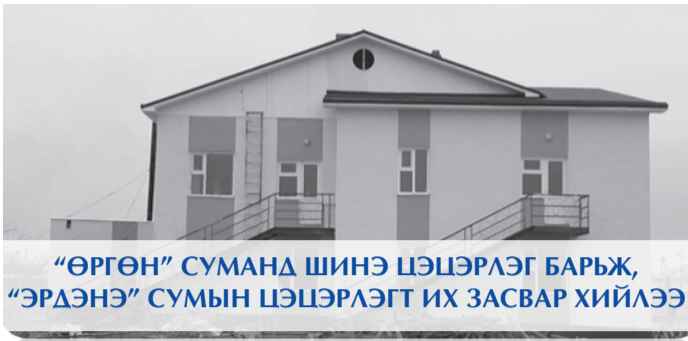
“ӨРГӨН” СУМАНД ШИНЭ ЦЭЦЭРЛЭГ БАРЬЖ, “ЭРДЭНЭ” СУМЫН ЦЭЦЭРЛЭГТ ИХ ЗАСВАР ХИЙЛЭЭ

“Өвсний үндэс-Хүний аюулгүй байдлыг хангах буцалтгүй тусламжийн хөтөлбөр”-ийн хүрээнд аймгийн Засаг дарга, Япон Улсын Элчин сайдтай гэрээ байгуулан 800.0 сая төгрөгийн хөрөнгө оруулалтаар Дорноговь аймгийн “Өргөн” суманд 100 хүүхдийн цэцэрлэгийг шинээр барьж, “Эрдэнэ” сумын хүүхдийн цэцэрлэгийн их засварын ажлыг 150.0 сая төгрөгийн хөрөнгө оруулалтаар хийж ашиглалтад хүлээлгэн өглөө.