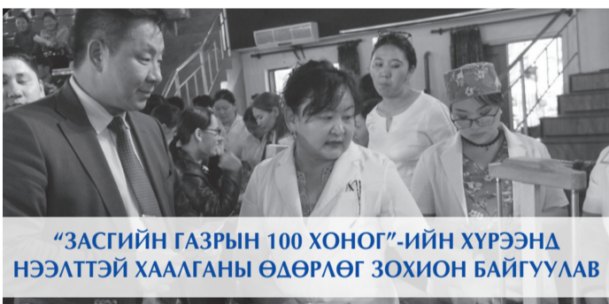
“ЗАСГИЙН ГАЗРЫН 100 ХОНОГ”-ИЙН ХҮРЭЭНД НЭЭЛТЭЙ ХААЛГАНЫ ӨДӨРЛӨГ ЗОХИОН БАЙГУУЛАВ

Аймгийн ИТХ, аймгийн ЗДТГ-аас иргэдийг орон сууцжуулах бодлогын хүрээнд баригдаж буй шинэ орон сууцнуудын чанар, стандарт, ашиглалтын явцад гарч буй асуудлууд түүнийг хэрхэн шийдвэрлэх, иргэдийг эрүүл, аюулгүй тав тухтай орон сууцаар хангахад цаашид авч хэрэгжүүлэх арга хэмжээний талаар “Орон сууц-Эрүүл, аюулгүй, тав тухтай амьдралын баталгаа” хэлэлцүүлгийг зохион байгууллаа.