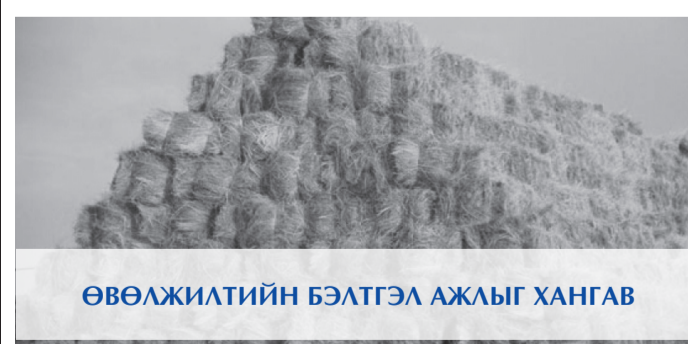
ӨВӨЛЖИЛТИЙН БЭЛТГЭЛ АЖЛЫГ ХАНГАВ

Монголын мэргэшсэн нягтлан бодогчдын институтын 20 жилийн ойн арга хэмжээний хүрээнд “Мэргэжилдээ баярлалаа” аяныг аймгийн хэмжээнд зохион байгууллаа. Энэхүү аяны хүрээнд аймаг орон нутагтаа өөрийн оюун бодлоо дайчлан ажиллаж буй нийт 75 санхүүчид, нягтлан бодогчдыг хамруулсан уулзалт, зөвлөгөөнийг зохион байгуулав. Орон нутгийн төсвийн орон нутгийн хөгжлийн бодлоготой уялдуулан ил тод, нээлттэй төлөвлөн хуваарилж, салбарын хөгжлийг дэмжихэд чиглэсэн төсөв, санхүүгийн зөв зохистой бодлогыг баримтлах талаар мэргэжил, арга зүйн зөвлөгөө өглөө.