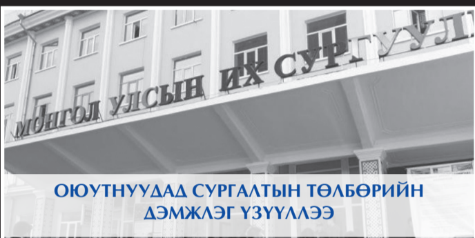
ОЮУТНУУДАД СУРГАЛТЫН ТӨЛБӨРИЙН ДЭМЖЛЭГ ҮЗҮҮЛЭЭ

Монгол Улсын Ерөнхий сайд Ж.Эрдэнэбат тэргүүтэй албаны хүүүүс 2016 оны арваннэгдүгээр сарын 07-ны өдөр Даланжаргалан суманд үйл ажиллагаагаа явуулж буй Хөх цавын цемент шохойн үйлдвэртэй танилцлаа. Хөх цавын цемент шохойн үйлдвэрийг 2017 оны эхний улиралд багтаан ашиглалтад оруулахаар боллоо. Тус үйлдвэр ашиглалтад орсноор 900 гаруй ажлын байр шинээр бий болж, орон нутгаас ажиллах хүчний 50 хувийг бүрдүүлнэ. Хөх цавын цемент, шохойн үйлдвэрийн ажилчдын тосгоныг Даланжаргалан суманд байгуулахаар болов.