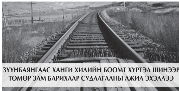
ЗҮҮНБАЯНГААС ХАНГИ ХИЛИЙН БООМТ ХҮРТЭЛ ШИНЭЭР ТӨМӨР ЗАМ БАРИХААР СУДАЛГААНЫ АЖИЛ ЭХЛЭЛЭЭ

Өргөн болон нарийн царигийн ачилт буулгалтын 11.6 км орчим төмөр зам, ложистикийн төв рүү орох-гарах хүнд даацын 19 у/м төмөр бетон гүүрэн байгууламж, 1.6 км автозам, 50 тн, 70 тн гүүрэн краан, эрчим хүчний 110 кВт-ын ЦДАШ, 2*630кВа, 2*16000кВа цахилгааны дэд өртөөнүүд, дулаан, цэвэр, бохир усны шугам сүлжээ, холбооны сүлжээ бүхий нийт 128 га талбайг хамарсан Ложистикийн төвийг байгуулах ажлыг эхлүүлээ.