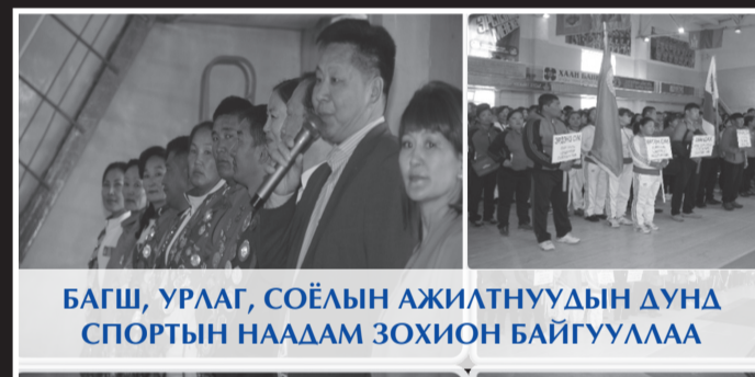
БАГШ, УРЛАГ, СОЁЛЫН АЖИЛТНУУДЫН ДУНД СПОРТЫН НААДАМ ЗОХИОН БАЙГУУЛАА

“ЗАСГИЙН ГАЗРЫН 100 ХОНОГ” өдөрлөгийн хүрээнд аймгийн ЗДТГ, түүний харьяа агентлаг, төсөвт байгууллагууд, сумдын Засаг даргын Тамгын газар нээлттэй хаалганы өдөрлөгийг 2016 оны аравдугаар сарын 04-ний өдөр Сайншанд суманд зохион байгууллаа. Энэхүү өдөрлөгөөр Засгийн газар шинэчлэн байгуулагдсан 100 хоногийн хугацаанд орон нутагт хийж хэрэгжүүлсэн арга хэмжээ, цаашид хэрэгжүүлэх бодлого зорилтын талаар иргэдэд танилцуулав.