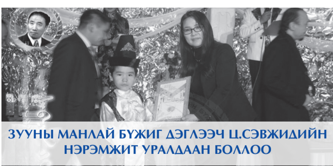
ЗУУНЫ МАНЛАЙ БҮЖИГ ДЭГЛЭЭЧ Ц.СЭВЖИДИЙН НЭРЭМЖИТ УРААДААН БОЛОО

Дорноговь аймаг, БНХАУ-ын ӨМӨЗО-ны хамтын ажиллагааны хүрээнд Хөх хотын Олон улсын Монгол эмнэлгийн 12 эмч зүрх судас, мэдрэл, дотор, гэмтэл, чих хамар хоолой, нүд, эмэгтэйчүүд зэрэг чиглэлээр 1172 иргэнд үнэ төлбөргүй үзлэг оношилгоо хийж, 307 иргэнд эмчилгээ хийлээ. ӨМӨЗО-ны Олон улсын Монгол эмнэлгээс аймгийн Эрүүл мэндийн газарт 17.0 сая төгрөгийн үнэ бүхий нярайн шарлагын фото аппаратыг бэлэглэв. Цаашид хоёр орны эмч, эмнэлгийн мэргэжлийн ажилтнуудыг харилцан солилцож туршлага судлуулах замаар энэхүү арга хэмжээг уламжлал болгох зохион байгуулахаар боллоо.