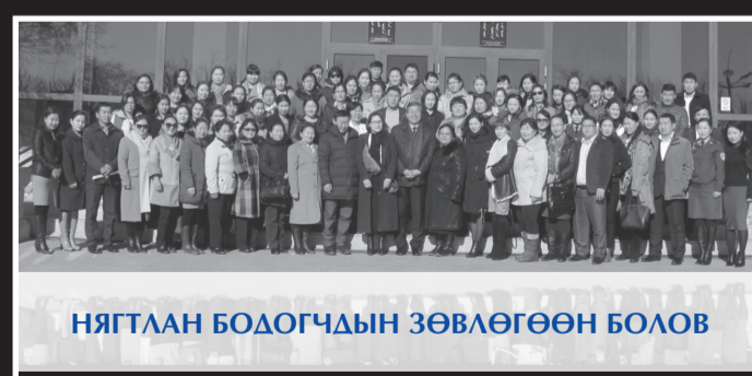
НЯГТЛАН БОДОГЧДЫН ЗӨВЛӨГӨӨН БОЛОВ

Монгол Улсын Төрийн шагналт, Ардын бүжигчин, Урлагийн гавьяат зүтгэлтэн Зууны манлай бүжиг дэглээч Ц.Сэвжид агсны 100 жилийн ойн хүрээнд өсвөрийн бүжигчдийн улсын XXIII наадамд 10 аймаг, Улаанбаатар хотын зургаан дүүргийн 240 гаруй өсвөрийн бүжигчид оролцлоо. Энэхүү арга хэмжээг зохион байгуулахад орон нутгийн төсвөөс 5.6 сая төгрөгийн дэмжлэг үзүүлээ.