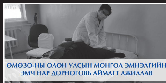
ӨМӨЗО-НЫ ОЛОН УЛСЫН МОНГОЛ ЭМНЭЛГИЙН ЭМЧ НАР ДОРНОГОВЬ АЙМАГТ АЖИЛЛАВ

“Газрын шим-говийн ногоо” уулзалт, хэлэлцүүлгийн үр дүнд Сайншанд суманд дөрвөн улирлын нарлаг хүлэмж байгуулах, Алтанширээ сумын “Сайн-Ус” багт газар тариалангийн бүс байгуулах, Артезын усыг түшиглэн 9 гад дуслын услагааны систем бүхий иж бүрэн услагааны барилга байгууламж барьж, аймгийн төвд нэгдсэн зорь байгуулахаар шийдвэрлэлээ.