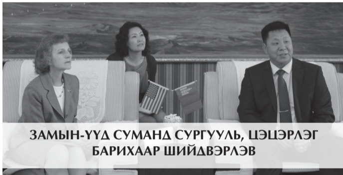
ЗАМЫН-ҮҮД СУМАНД СУРГУУЛЬ, ЦЭЦЭРЛЭГ БАРИХААР ШИЙДВЭРЛЭВ

АНУ-аас Монгол Улсад суугаа Онц бөгөөд бүрэн эрхт Элчин сайд, хатагтай Женифер Зимдал Гаит 2016 оны долдугаар сард Дорноговь аймагт айлчлав. Энэхүү айлчлалын хүрээнд Замын-Үүд суманд хүүхдийн цэцэрлэг, сургуулийн барилга барихаар шийдвэрлэсэн бөгөөд барилгын ажлыг 2017 оны II улиралд эхлүүлэхээр боллоо.