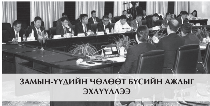
ЗАМЫН-ҮҮДИЙН ЧӨЛӨӨТ БҮСИЙН АЖЛЫГ ЭХЛҮҮЛЭЭ

БНХАУ, Монгол, ОХУ хоорондын бүс нутгуудын эдийн засаг, худалдааны идэвхтэй харилцан ашигтай хамтын ажиллагааг идэвхжүүлэх зорилгоор гурван улсын эдийн засаг, худалдааны хамтын ажиллагааны чуулганыг БНХАУ-ын ӨМӨЗО-ны Шилийн гол аймгийн Шилийн, Эрээн хотуудад 2016 оны есдүгээр сард зохион байгуулав. Энэхүү чуулганы гол онцлог нь гурван улсын аж ахуйн нэгжүүдийн худалдааны харилцаа, эрүүл мэнд, аялал жуулчлал болон эдийн засаг, худалдааны харилцааг бэхжүүлэхэд оршино.