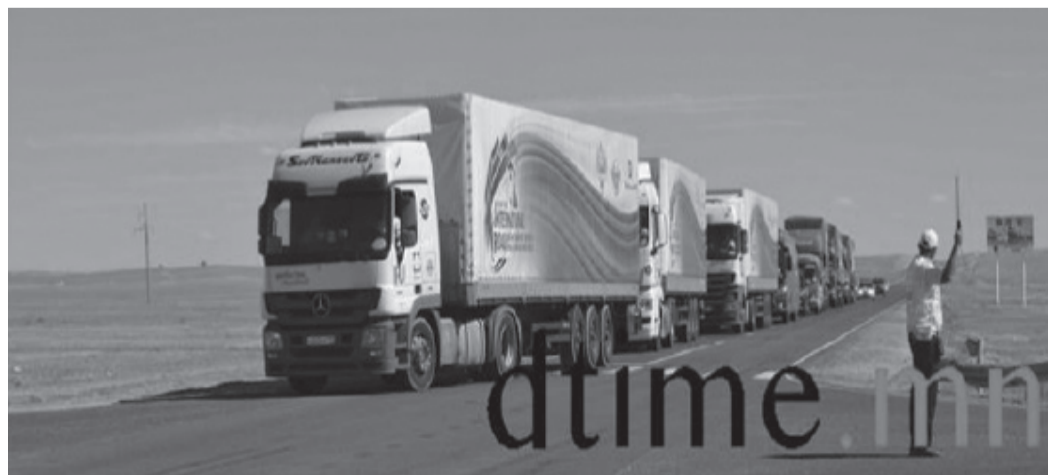
ГУРВАН УЛСЫН ТРАНЗИТ ТЭЭВРИЙН ЦУВАА ДОРНОГОВЬ АЙМГИЙН НУТГААР ДАМЖИНА

Аймаг байгуулагдсаны 85 жилийн ойн баяр наадмыг долдугаар сарын 29, 30-ны өдрүүдэд Сайншанд хотноо өргөн дэлгэр зохион байгуулав.