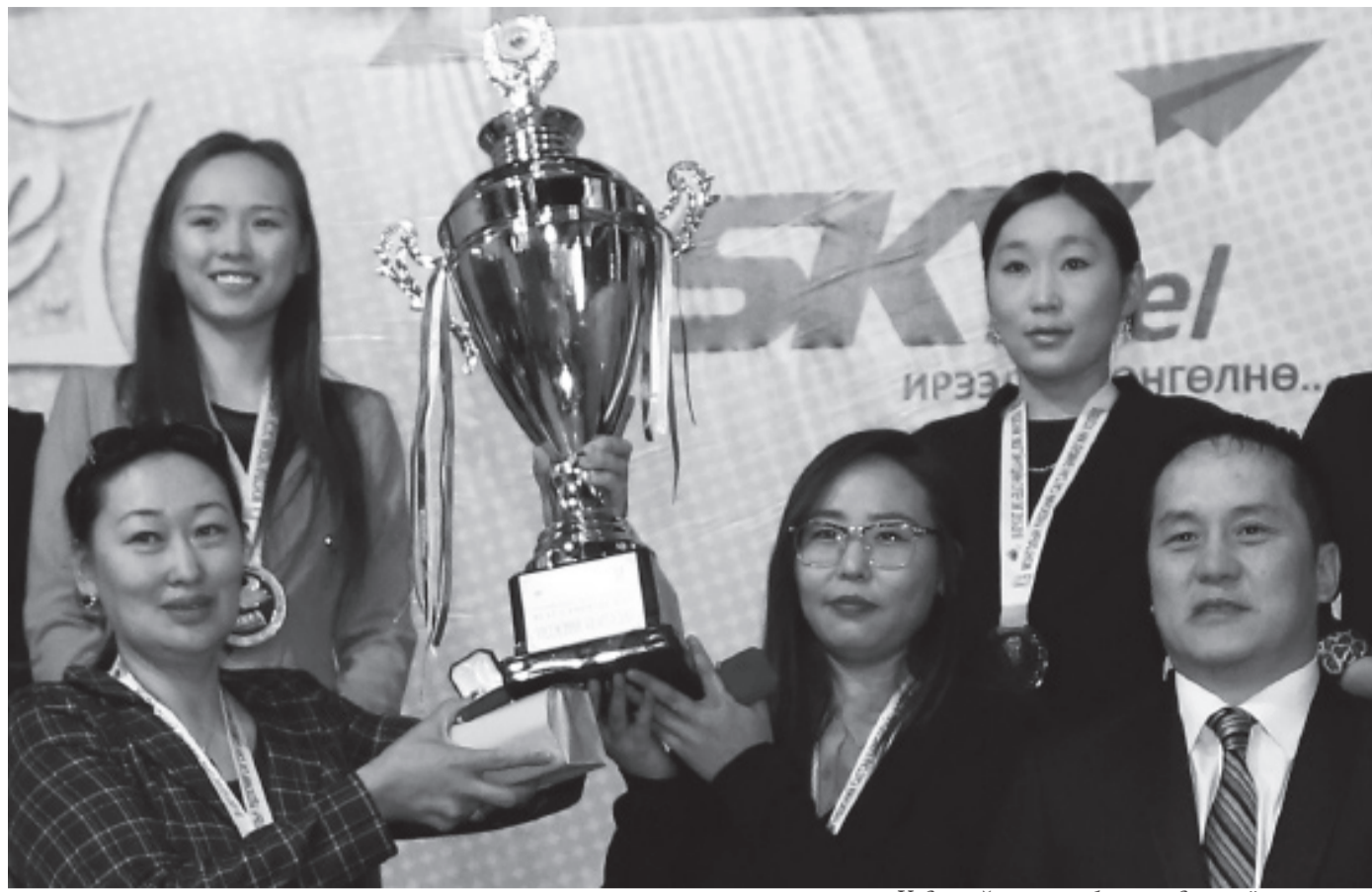
Үндэсний аваргын бөгж гардуулах ёслолын үеэр

-2012 онд 45 хоногийн курст яваад, цагдаа болсон. Би одоо эргүүлийн цагдаа хийдэг. Таван жилийн турш эргүүлийн цагдаагийн ажлаа хийгээд л явж байна даа. Байнга эргүүлд гарна. Хэрвээ тэмцээнд оролцохоор болбол ажлаас чөлөө олгоно. Гэхдээ байнга чөлөө өгнө гэж