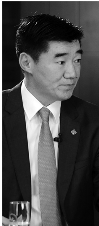
/Хууль зүй, дотоод хэргийн сайд/

С.Бямбацогт: Бохир мөнгөө нууж байгаад хуулийн хараа хяналтаас мултарна гэж бодож байгаа бол том эндүүрэл