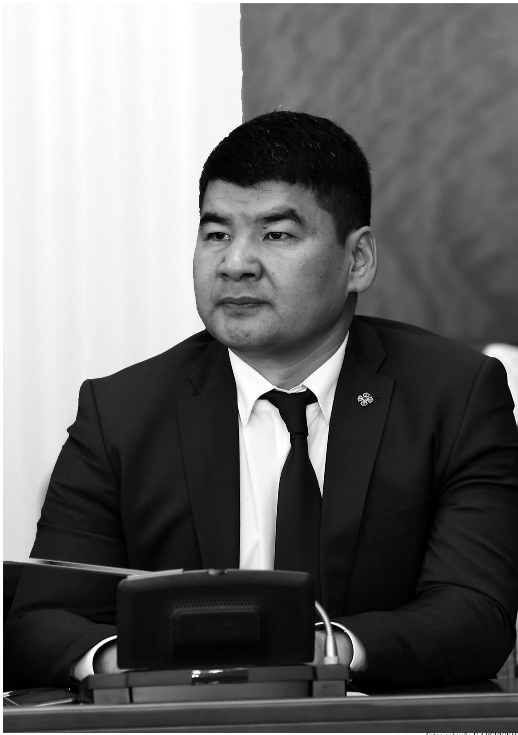
Г.Эрэн зураач Г.АРТ УУЖИН

хойшлуулсан. Ийнхүү өвөлжилтийн бэлтгэл ажил оройтсон учир эрчимжүүлсэн төлөвлөгөө гаргасан. Улмаар бэлтгэл ажлаа бүрэн хангаж чадсан. Хүндрэлтэй зүйл гэвэл нүүрсний асуудал байсан. Ялангуяа “Багануур”-ын уурхай өнгөрсөн наймдугаар сарын төгсгөлд өвөлжилтийн бэлтгэл ажил 45 хувьтай байсан. Ийнхүү төвийн бүсийн III, IV станцуудын эрчим хүчний дийлэнх хувийг хангадаг уурхай өвөлжилтийн бэлтгэл тааруу байгаа нь хамгийн хүндрэлтэй нөхцөл байдал үүсгэсэн. Тиймээс ч Засгийн газрын зүгээс яаралтай арга хэмжээ авч, төсвийн зээл олгоод, машин, тоног төхөөрөмжийн засварын асуудлыг нь шийдэж өгсөн. Өөрөөр хэлбэл, түлшний компаниудад “Шивээ овоо”, “Багануур”-ын уурхай нийтдээ 12 тэрбум орчим төгрөгийн өр хуримтлагдчихсан байсан. Өрийн асуудлаас болоод эдгээр уурхайнуудад түлш өгөхөө зогсоочихсон байсан. Түлшгүй учир уурхайнууд хөрс хуулалтаа хийж чадахгүй хүндрэн байдалд орсон. Уг нь бэлэн байх нүүрсний хэмжээ нийтдээ 450 орчим мянган тонн байж өвлийг бид давдаг. Гэтэл өнгөрсөн наймдугаар сарын сүүлийн байдлаар бэлэн нүүрсний хэмжээ дөнгөж 180 мянган тонн байсан. Хэрвээ энэ байдлаараа байсан бол өвлийг