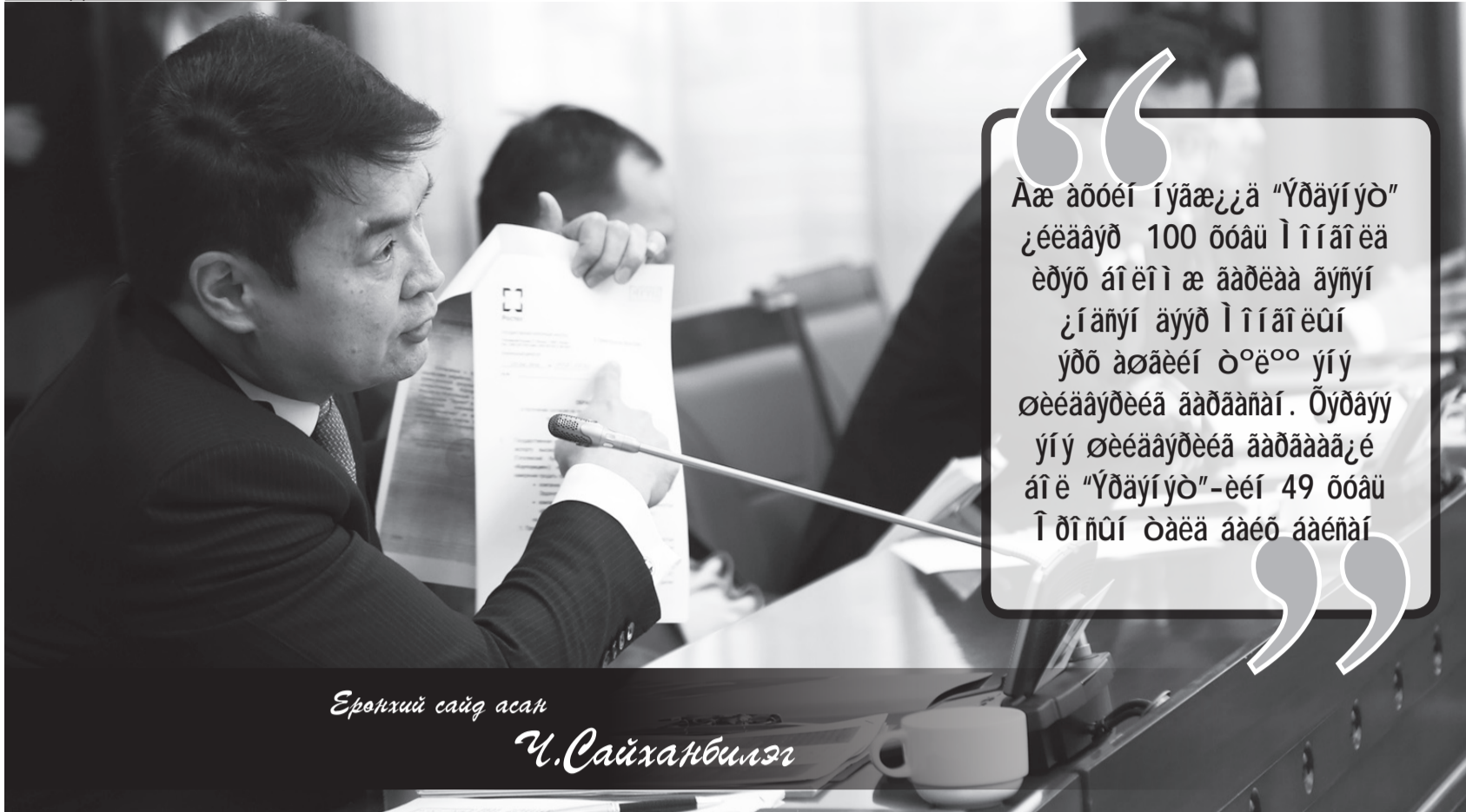
Ерөнхий сайд асан Ч.Сайханбилэг