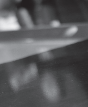
Гэрэл зургийн Г.АРГУУЖИН

Энэ бүх тохмилгооноос үзвэл МАН-ын амлалт энэ хугацаанд 100 хувь эсрэгээрээ болж байна гэдгийг тэрбээр онцолж байлаа. Учир нь МАН-ын Мөрийн хөтөлбөрийн 4.2.7-д Төрийн байгууллагыг удирдаж байгаа хүмүүс ах дүү, хамаатан саднаа ажилд авахыг хориглоно. 4.2.8-д Төрийн албанд шат ахуулан албан тушаал дэвшүүлэх Мерит тогтолцоог хэвшүүлэн гэсэн байгаа юм. Энэ талаар тэрбээр "Мерит тогтолцоо бол ажилдаа байгуулсан гавьяагаараа албан тушаал дэвчдэг зарчим байдаг. Гэвч бодит байдал дээр юу болсныг хүмүүс мэднэ. Монголыг ирэх дөрвөн жил удирдах баг тэр чигтээ МАН-ын удирдах албан тушаалтнуудын ах дүү амраг садан гэр бүлийн баг байх юм гэдгийг 100 хоногийн хугацаанд харлаа. Ах дүү, амраг садан нийлээд төр удирдана гэдэг бол нэгийгээ шүүмжлэхгүй гэсэн үг. Буруу зүйл хийсэн бол алдааных нь хажуугаар чимээгүй өнгөрнө. Жирийн иргэн хүн улс эх орондоо мөрөөдлөө биелүүлэх боломжгүй болж байна. Яаманд мэргэжилтэн хийж байгаа олон залууст мөрөөдөл бий. Тэдгээр чадварлаг залуусын мөрөөдөл биелэхгүй байх суурийг МАН тавилаа.