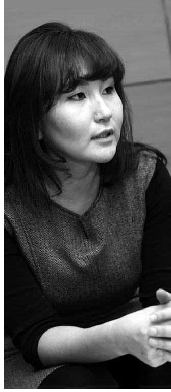
/Санхүү эдийн засгийн дээд сургуулийн Санхүүгийн тэнхимийн эрхлэгч/

Б.Мөнхзаяа: Гадны банкиг оруулах цаг нь одоо биш