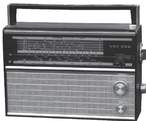
"ВЭФ 206" Радио хүлээн авагч нь Монгол улсад 1980, 1990, 2000 онуудад нутагшиж-ашиглагдаж байсан