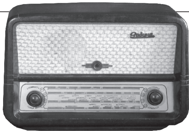
"Эх орон 52" Радио хүлээн авагч нь Монгол Улсад 1950, 1960, 1970 онуудад нутагшиж-ашиглагдаж байсан