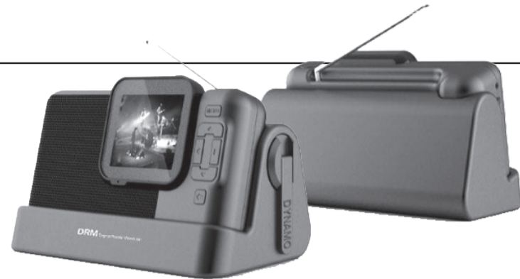
"Di-Wave 100" Тоон радио хүлээн авагч нь Монгол Улсад 2010, 2020 онуудад нутагшиж-ашиглагдаж байна