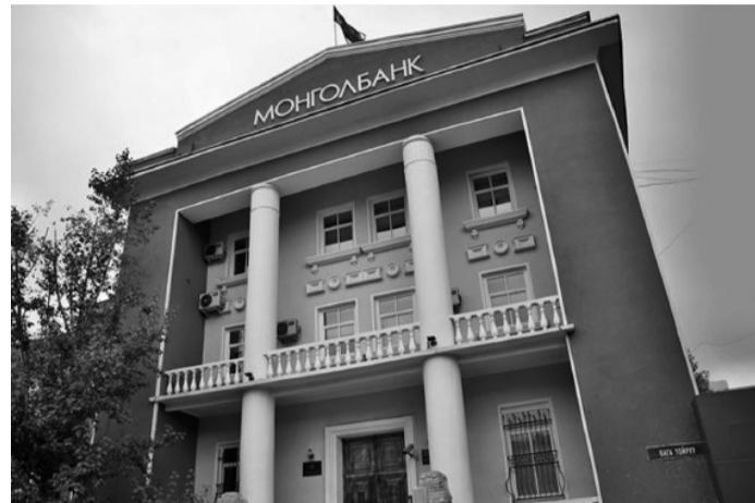
Монгол банк: Дифляци улирлын чанартай