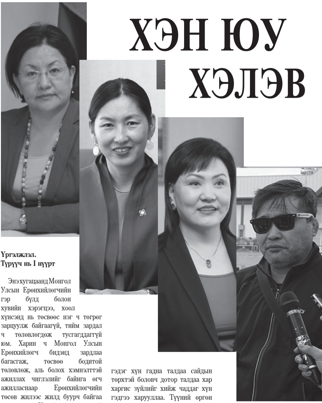
Үргэлжлэл. Түүрч нь I нүүрт

Энэхугацаанд Монгол Улсын Ерөнхийлөгчийн гэр бүлд болон хувийн хэрэгцээ, хоол хүнсэнд нь төсвөөс нэг ч төгрөг зарцуулж байгаагүй, тийм зардал ч төлөвлөгдөж тусгагддаггүй юм. Харин ч Монгол Улсын Ерөнхийлөгч бидэнд зардлаа багасгаж, төсвөө бодитой төлөвлөж, аль болох хэмнэлттэй ажиллах чиглэлийг байнга өгч ажилласнаар Ерөнхийлөгчийн төсөв жилээс жилд буурч байгаа шүү дээ. Үүнийг ойлгомжтой болгохын тулд ганцхан тоо хэлье л дээ. 2016 оны төсвийг 2013 онытой харьцуулахад бид нийт төсвөө 2, 3 дахин бууруулж чадсан. Үүнийг жил жилийн Төсвийн тухай хуулиас үзэж болно. Харин Монгол Улсын Төрийн тэргүүний хувьд гадаад, дотоод арга хэмжээний үеэр зочид, төлөөлөгчдөд барих зоогийн төсөв бий. Түүнийг батлагдсан төсвийн хэмжээнд зарцуулдаг. Энэ дашрамд ний нуугүй хэлэхэд зочид барьсан зоог, хоолны зардлаа Ерөнхийлөгч хувиасаа төлчихдөг тохиолдол зөндөө л байдаг. Иймд олон нийтийн сүлжээгээр явуулж байгаа Ерөнхийлөгч өдөрт 1,3 сая төгрөгийн хоолны төсөвтэй гэсэн худал мэдээлэл, гүтгэлгээ зогсоох хэрэгтэй. Нөгөө талаас иргэд ийм мэдээлэлд итгэх хэрэггүй юм” хэмээн ярьсан байна.