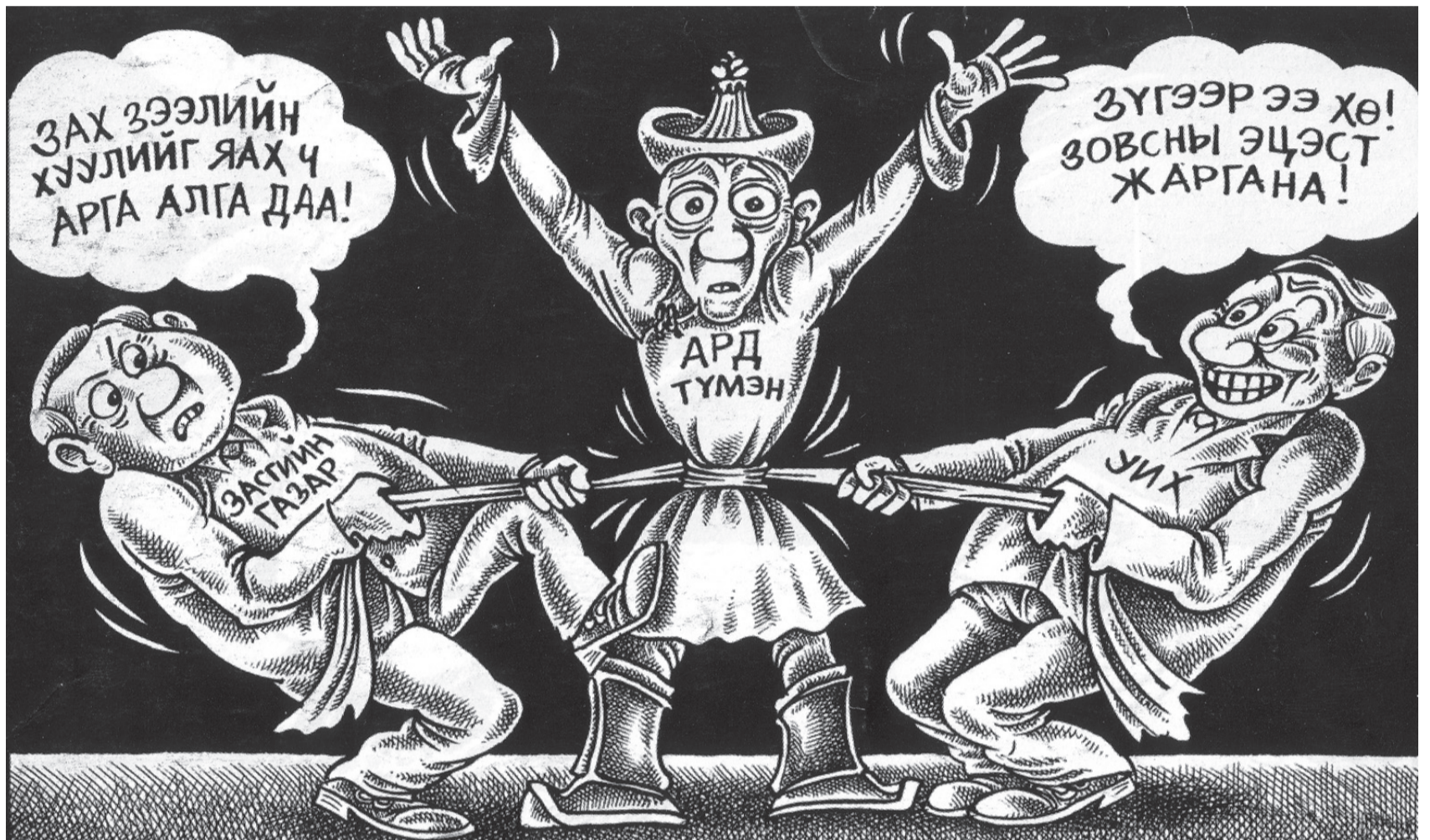
Шог зургийг С.Цогтбаяр

Монгол Улсын эдийн засгийн нөхцөл байдал нэлээд хүнд шат руугаа орчихсон байгаа. Үүнийг эдийн засагчид ч хэлж байна. Эрх барьж байгаа МАН-ынхан бол бүр "давс" нэмээд, илүү сүржингээд байгаа. Гэхдээ хэн нь юу гэж ярихдаа гол биш, эдийн засгаа одоо л эрүүлжүүлж авахгүй бол бид хэцүүхэн байдалд тун удахгүй орно гэдэг нь үнэн. Харин эдийн засгийг эрүүлжүүлэхийн тулд бид юу хийх ёстой вэ. Одоогоор Засгийн газар төсөв хэмнэх аргыг нэн түрүүний сонголт болгож, чадах бүхнээ хийх гэж оролдож байна. Төсөв хэмнэх "дайн"-д хэн илүү хохирох гээд байгааг харвал ард түмэн. Мэдээж төсвийн хэмнэлт хийхдээ хэт өндөр цалинтай дарга нарын халаасалж буй мөнгөний тодорхой хувийг төр авч үлдэх гэж байна. Оюутнуудад өгч байгаа халамжуудыг зогсоохоор болж байгаа бололтой. Дээрээс нь дарга нарын утасны мөнгө, гадаад руу явах зардал гэх мэт үр ашиггүй урсгадаг мөнгийг танах сураг байсан. Гэх мэт олон зөв шийдвэрүүд гарсан.