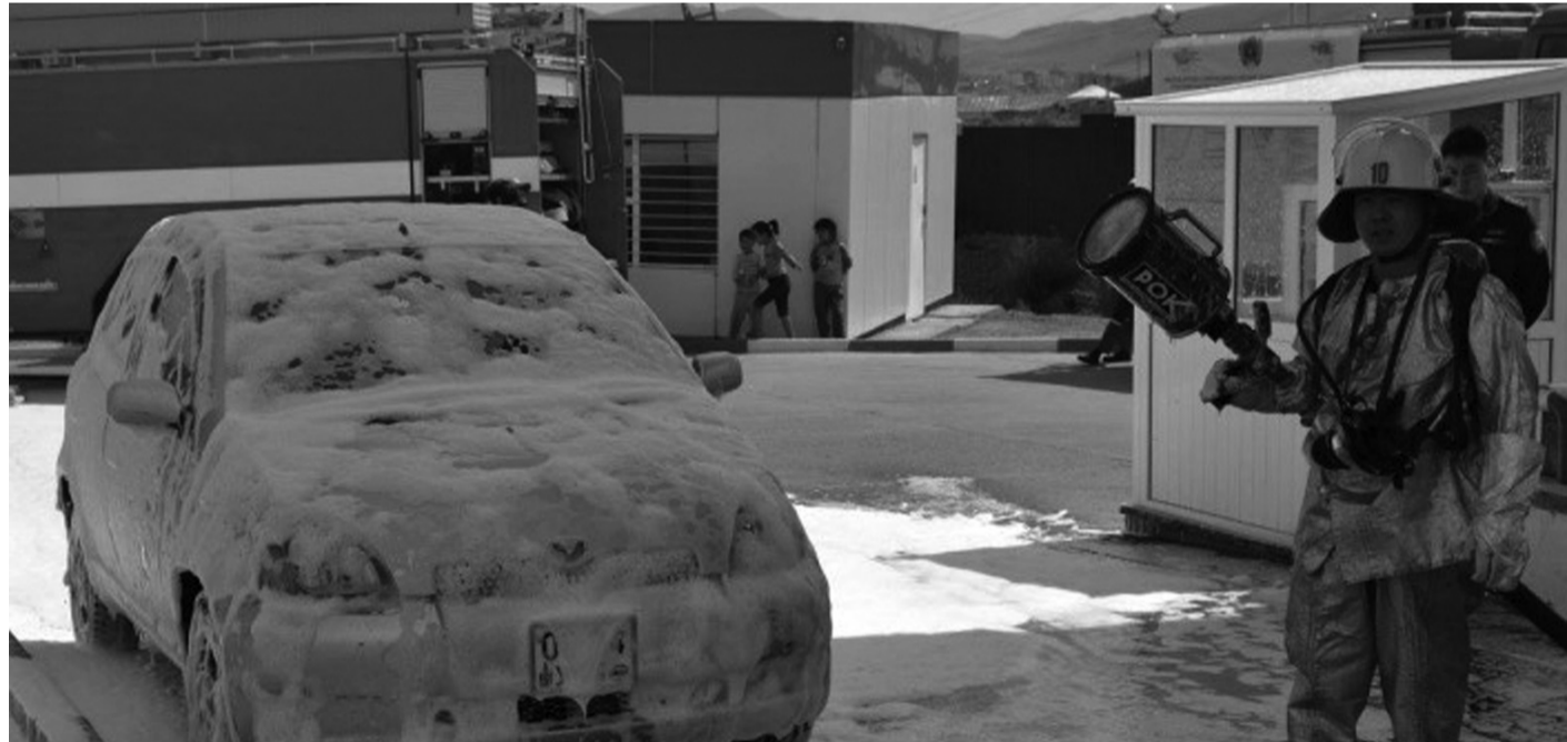
Нийслэлийн Чингэлтэй дүүргийн Онцгой байдлын хэлтсийн бие бүрэлдэхүүн Тэс нефролизт шатаахуун түгээх станц дээр гал унтраах тактикийн сургууль очигдөр зохион байгууллаа. Тус сургуульд Чингэлтэй дүүргийн хэлтэстэй 17 шатаахуун түгээх станцын 45 ажилтан, албан хаагчид оролцов. Сургалтад оролцогчид галшигаас хамгаалах, галын аюулаас урьдчилан сэргийлэх чиглэлээр танхимын сургалтад хамрагдаж, гал унтраах дадлага сургууль хийсэн юм.