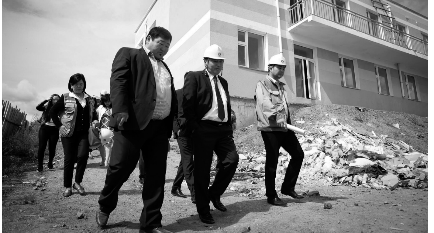
Гэрэл зургийг Г.АРИУУЖИН