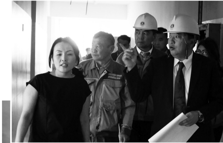
Нийслэлийн Засаг дарга С.Батболд сургууль, ичирлэгийн барилгын үйл явцтай өнгөрсөн баасан гарагт танилцлаа. Тэрбээр, Чингэлтэй дүүргийн 16 дугаар хороо буюу Хайлаастын эцэст байрлах ичирлэг, бага сургуулийн цогцолбор барилга, Баянзүрх дүүргийн 13 дугаар хороонд байрлах 14 дүгээр сургуулийн барилга, Сүхбаатар дүүргийн IV дүгээр хороонд байрлах нэгдүгээр ичирлэгийн өртөөгийн барилга болон Баянгол дүүргийн 18 дугаар хороонд байрлах 11 дүгээр ичирлэгийн барилгын ажлын явцтай танилцсан юм.