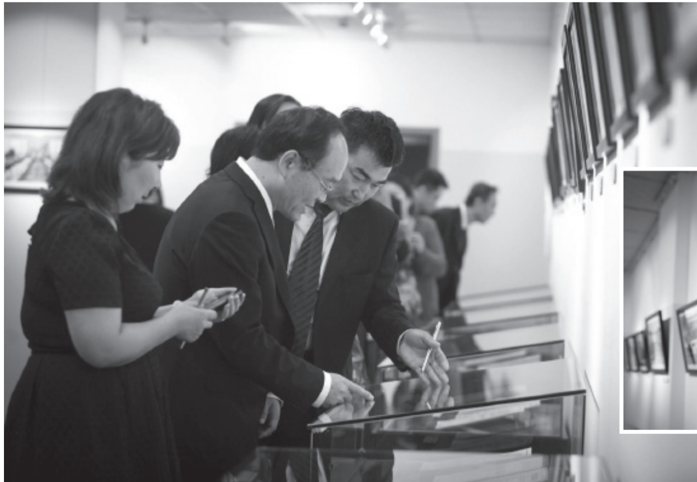
2014 онд байгуулсан халтын ажиллагааны хэлэлцээрийн дагуу БНХАУ-ын Төрийн архивын удирдах газрын төлөөлөгчид Монгол Улсын нийслэл Улаанбаатар хотноо 2016 оны наймдугаар сарын 15-19-ний өдрүүдэд албан айлчлал хийх гэж байгаатай холбогдуулан "МОНГОЛ-ХЯТАДЫН ТҮҮХЭН ХАРИЛЦАА /1949-2016/" сэдэвт архивын барилт, кино, гэрэл зургийн үзэсгэлэн өчигдөр нээгдлээ. Үзэсгэлэнд улс төр, эдийн засаг, нийгэм, соёл, шинжлэх ухаан, бүтээн байгуулалтын холбогдолтой архивын барилт, кино, гэрэл зургийг дэлгээн үзүүлж, барилтыг монгол хятад хэлээр тайлбарлаж байна.