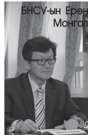
БНСУ-аас Монгол Улсад суугаа Элчин сайд У Сун

Монгол Улсын Нийслэл Улаанбаатар хотоор явахад солонгос хэлээр мэндлэх монгол хүмүүс олон тааралддаг. Зөвхөн мэндлээд зогсохгүй