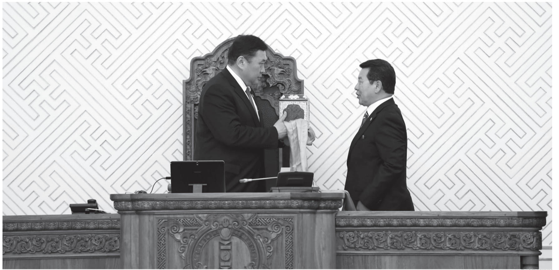
Үргэлжлэл нь III нүүрт